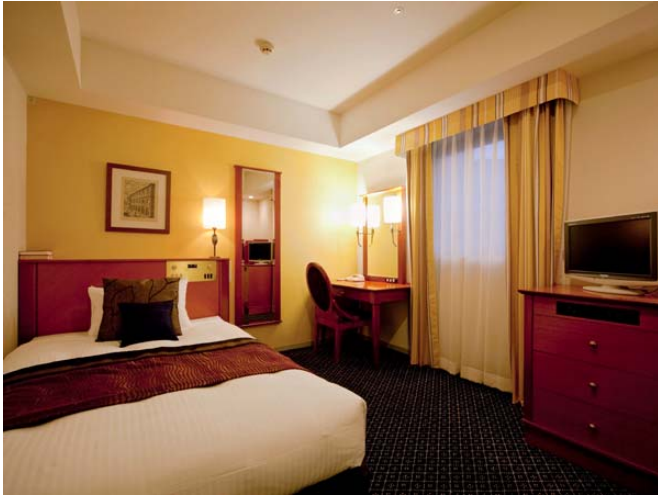
スタンダードシングル(16 m 2 )

2011年2月1日、さらなる進化を目指し、「Classical modern essence of Italy」をコンセプトとして「全客室」をリニューアル。イタリアンアーティストの家具に囲まれながら開放的なカラーを取り入れた、プライベート空間が誕生いたしました。