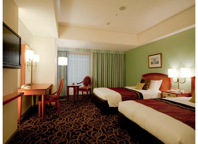
スーペリアツイン(29 m 2 )