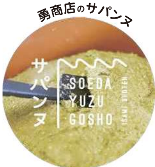
秘伝の石臼ですり潰した青柚子が上品 な味わいを醸し出し、料理に彩を