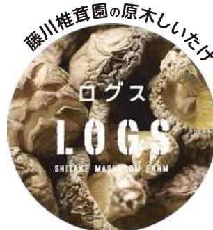
しっかりと育った厚みある原木椎茸で こそ出せる深い旨みで料理が一変