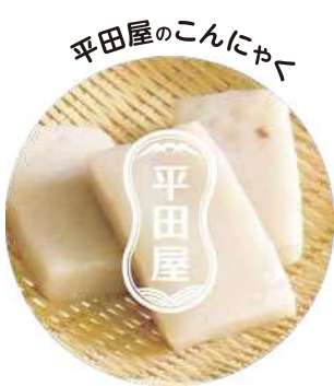
丁寧に手間暇かけて釜で炊き上げた こんにやくは驚くほどの好食感